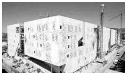
Imagen del estado de las obras de la Ciudad de la Justicia de Córdoba.

mitar y que se cifra en casi 400.000 anuales. La siguiente fue la de Almería, más modesta pero igual de costosa –más de 40 millones de euros–; tampoco ha eliminado de plano todas las demás sedes, ya que aún se conserva el Palacio de Justicia. La siguiente en abrir sus puertas será la de Córdoba; ha contado con un presupuesto de 65 millones de euros y se encuentra entre ambas en cuanto a su extensión. Con retrasos respecto a los plazos previstos, estará a pleno rendimiento el próximo año. Es la más original desde un punto de vista de diseño arquitectónico.